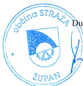
Dušan Krštinc, župan

Obvestilo posameznikom po 13. členu Splošne uredbe o varstvu podatkov (GDPR) glede obdelave osebnih podatkov v elektronskih zbirkah in zbirkah dokumentarnega gradiva Občine Straža je objavljeno na spletni strani: https://www.obcina-straza.si/GDPR .